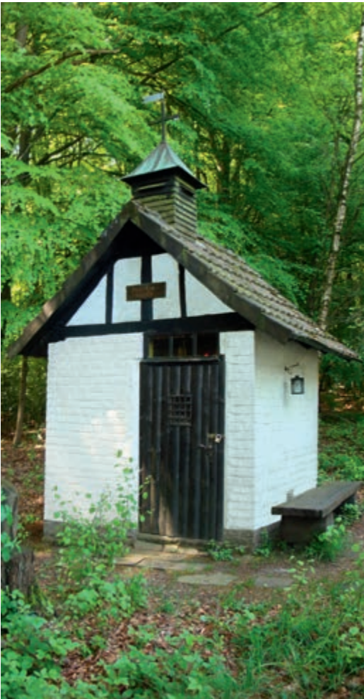
Die kleine Hubertus-Kapelle in der Nähe des Begräbniswaldes Eitorf